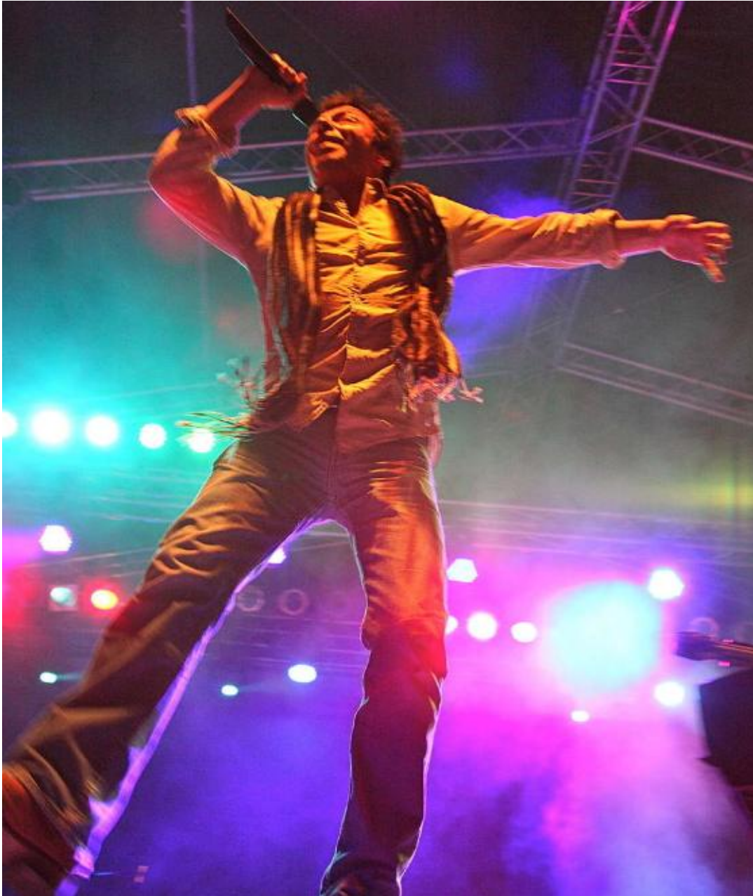
Purple Schulz in Aktion

damit an Wertigkeit verloren. Diesen Trend wollte ich nicht mitmachen und habe alle meine aktuellen Alben aus den Streaming-Diensten entfernt. Es steckt viel Arbeit dahinter, einen Song auf die Bühne und CD zu bringen. Das darf nicht umsonst sein. Kultur sollte auch weiterhin ihren Preis haben, ansonsten verhungern die Kulturschaffenden. Vielleicht würde ich mich heutzutage mit der Paläontologie beschäftigen oder Theater spielen. Aber ganz sicher würde ich zumindest nebenher auch Songs schreiben.“