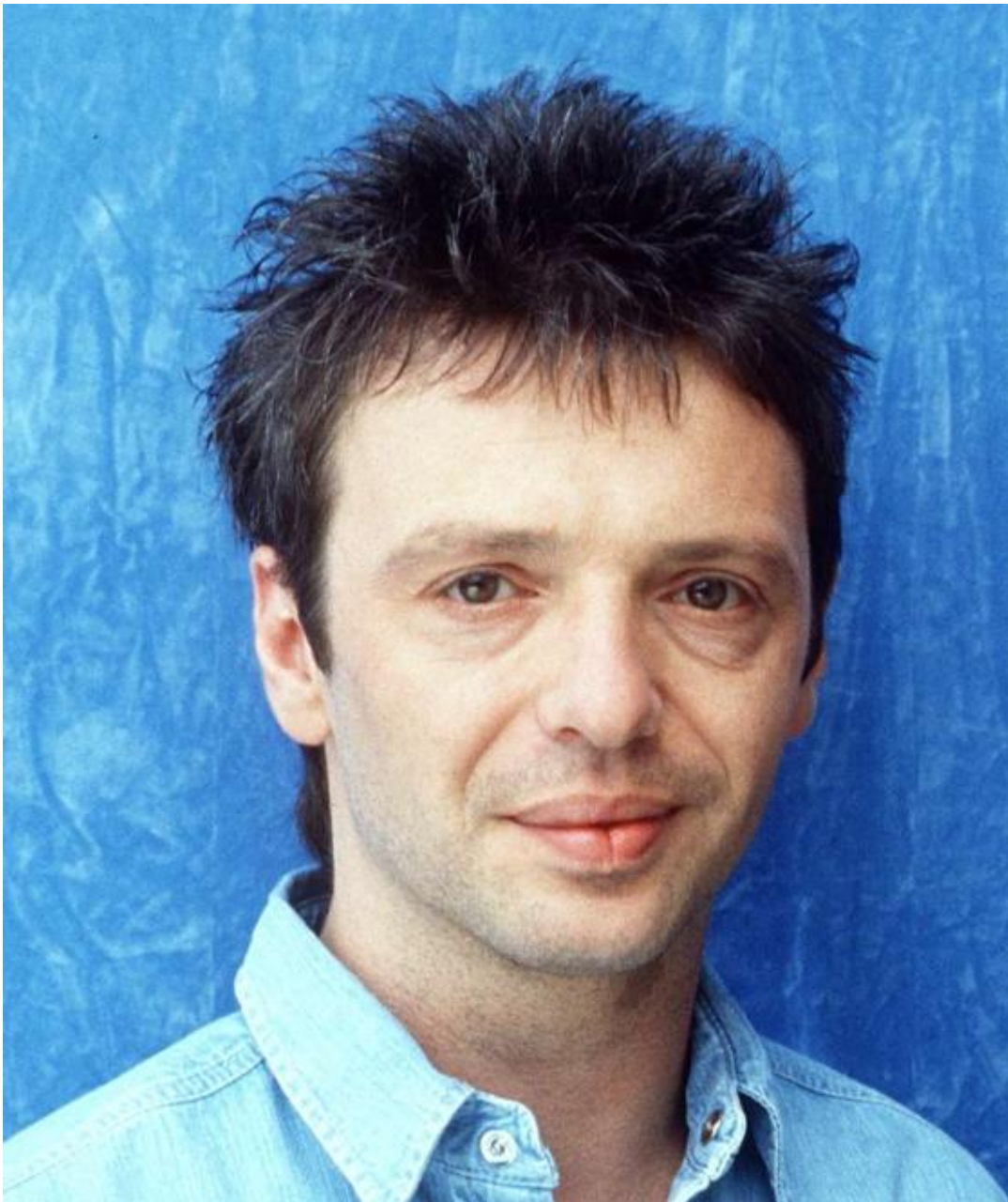
Purple Schulz in den 90er-Jahren